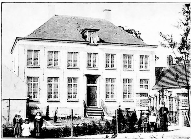
PASTORIJ VAN BEERSE